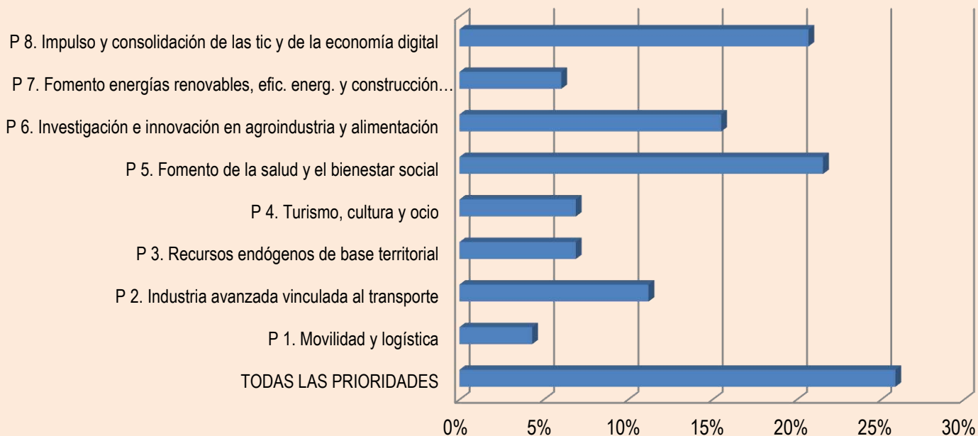
Actuaciones implementadas 2014-2018 por Prioridad RIS3Andalucía

Fuente: Elaboración propia a partir sistema de seguimiento